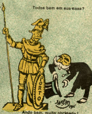
Ando bem, muito obrigado!