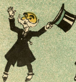
Como vão os seus meninos?