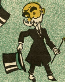
Como vai V. Ex.ª?