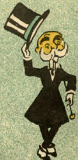
E V. Ex.ª como anda?