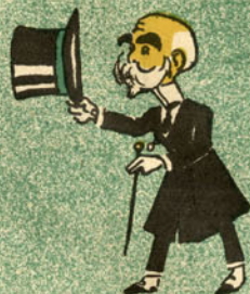
V. Ex.ª como vai?