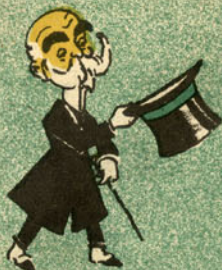
Como está V. Ex.ª?