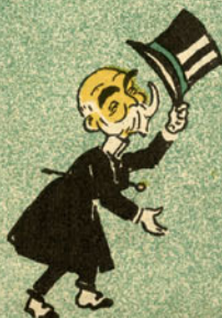
V. Ex.ª como passou?