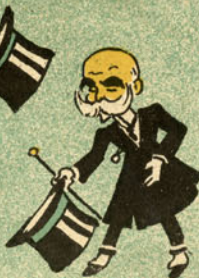
Em sua casa todos bem?