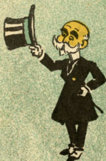
E a senhora sua tia?