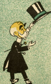
D. Joaquina como está?