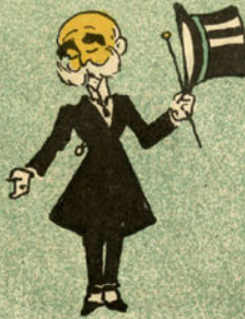
Sua tia vai melhor?