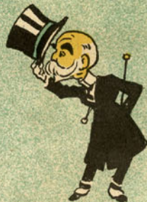
Todos bem em sua casa?