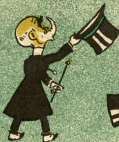
V. Ex.ª como está?