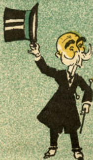
Como passou V. Ex.ª?