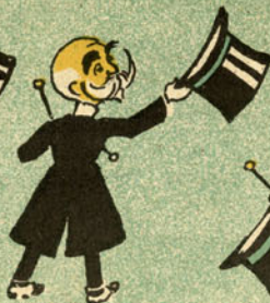
Os seus meninos como vão?